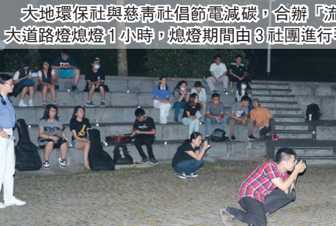
大地環保社與慈青社提倡節電減碳，合辦「流明警聲」關燈晚會，18 日晚間宮燈大道路燈熄燈 1 小時，熄燈期間由 3 社團進行不插電音樂表演。

僅有很多人參與也得到許多肯定，有父母帶著小朋友來看，也有許多老人家是生平第一次體驗用望遠鏡看月亮，在觀測當下令人很感動。 日研社 分享「水屋」準備工作 【記者陳岱儀淡水校園報導】日本文化研究社 18 日晚間邀請日文系助理教授廖育卿分享茶道前在「水屋」的準備工作。她表示，水屋是位於茶室旁，用來準備及清洗茶道具的空間，其中「篩茶粉」是最主要的工作，需先將茶粉篩到篩茶粉罐，接著蓋上蓋子以旋轉方式搖動，再將進茶粉的罐子「茶囊」中，堆成象徵日本精神的富士山形象。 社長財金二黎芳雯表示，透過體驗活動較能讓社員了解日本茶文化。日文二陳品諭說：「水屋的工作比想像中複雜，處理流程也有規範，日本茶道要求細節，讓我更加仔細地琢磨！」 火舞社 專業達人來校教學 【記者趙世勳淡水校園報導】火舞社於 14 日邀請 Coming True 表演工作坊的火舞街頭藝人豆腐(郭彥甫)授課，除教導新進學員基本動作外，也傳授新招式。副社長電機三盧昱翰表示，「由於本社創社一年，所以需要專業表演者來校授課，讓大家吸取更多經驗。」課後有許多學員圍著郭彥甫請教，互動熱烈。 學員資工三王昱力表示，「由於老師的經驗非常豐富，一下就看出每個人的問題所在，也教導我們很多招式小訣竅。我趁著這難得的機會請教老師，並修正自己的錯誤。我想，再把平常所學整合加強，應該能更快地進步。」