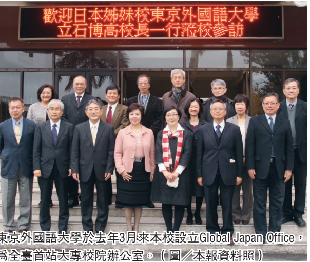
東京外國語大學於去年3月來本校設立Global Japan Office，為全臺首站專校院辦公室。