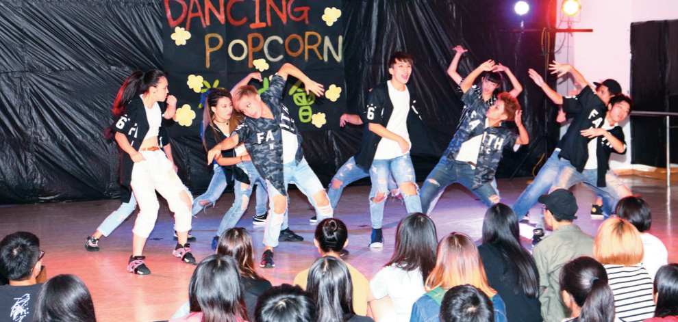
舞研研習社 21 日迎新安排 6 組表演，舞者們活力四射，引起全場熱烈迴響。