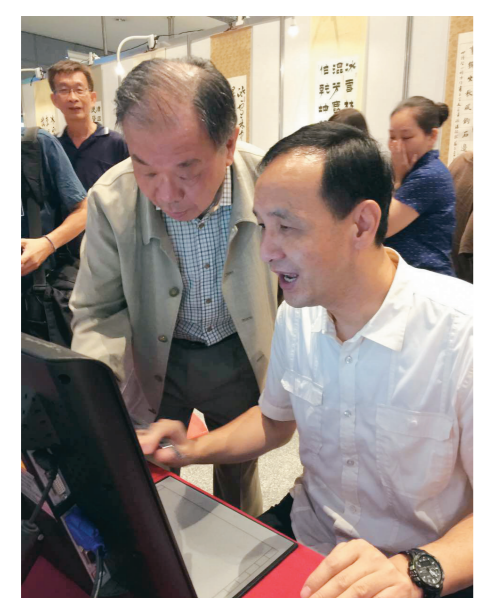
▲文鑄中心主任張炳煌(左)向新北市市長朱立倫(右)講解e筆。

張炳煌表示，藉由展示e筆過程中，得到青年族群的好評，期許更多人可以了解新的書寫科技工具，進入書法學習領域。