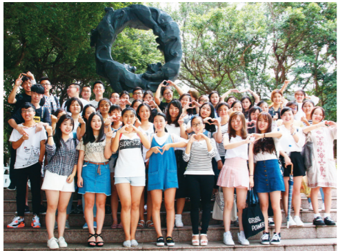
▲福建師範大學49位大三生來校參加文學院「文創學程閩台專班」，藉由課程內容和實習了解臺灣文創產業發展。

【記者廖吟萱淡水校園報導】文學院「文創學程閩台專班」開課囉！福建師範大學49位大三生於105學年度起，在本校修習一年的文創學程40學分課程，從中了解臺灣文創產業發展，以及實務經驗的交流。