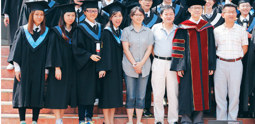
物理系首屆自辦畢業典禮，畢業生們與師長於化驗館前合影。

物理系首屆自辦畢業典禮，吸引近150位畢業生、家長、師長到場祝福，典禮上邀請畢業生共同拼出象徵物理系的創意拼圖。