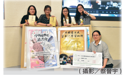
學生學習社群「中國書法暨創作學習社」奪冠

針對「學生學習」方面，學生學習發展組以學生學習社群、學習策略工作坊及學教翻轉走讀之旅、學教翻轉徵文比賽等方式落實「翻轉學習」理念。