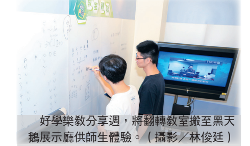
好學樂教分享週，將翻轉教室搬至黑天鵝展示廳供師生體驗。

建築系助理教授柯純融主講的教師社群為「製作與繪圖-淡江大一建築設計課程整合與發展」，宗旨為因應變動的科技與設計，進行建築系5年一輪的課程調整之需要，建立設計教學的課程設計與實施檢驗的成果，希望達到