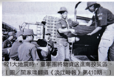
921大地震時，童軍團將物資送進南投災區。（圖/閻家璋翻拍《淡江時報》第410期。）

第927期《淡江時報》報導，該年4月10日，本校3位法文系學生在校內發起「淡江的島嶼天光」合唱活動，吸引近300位同學自主前往操場參與，歌唱著〈島嶼天光〉同時，參與者皆高舉向日葵傳達支持的決心。同時為切合實事，亦有以「民主？自由？不可忽視的公民力量！」為題舉辦講座，並邀請師生討論。為了探討根本問題，本校同時舉辦講座，期望能用正反觀點使學生更多元的角度探討服貿議題。在第930期《淡江時報》曾記錄當時遊